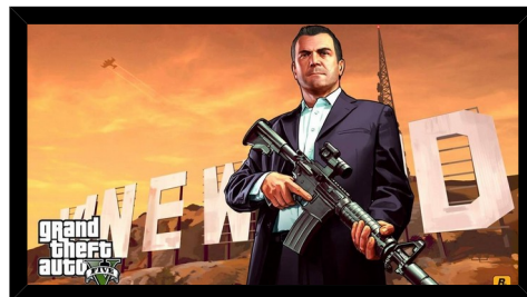
MICHAEL DE SANTA

Michael est un braqueur de banques, âgé de 45 ans. Il est riche et commet des vols pour être encore plus riche.